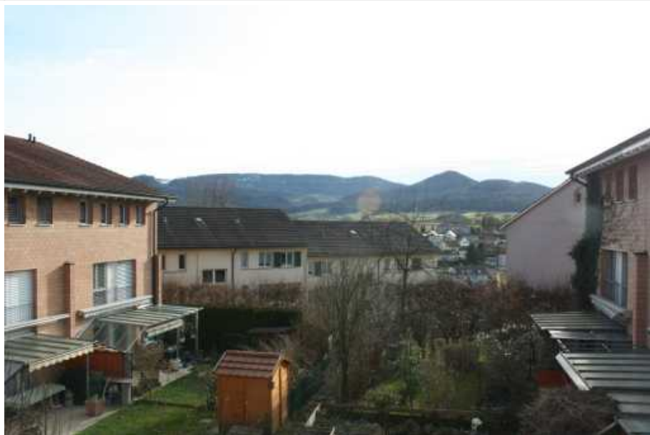
Aussicht von Terrasse