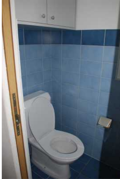
Gäste WC unten