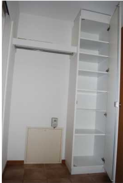
Einbauschränke im Eingangsbereich