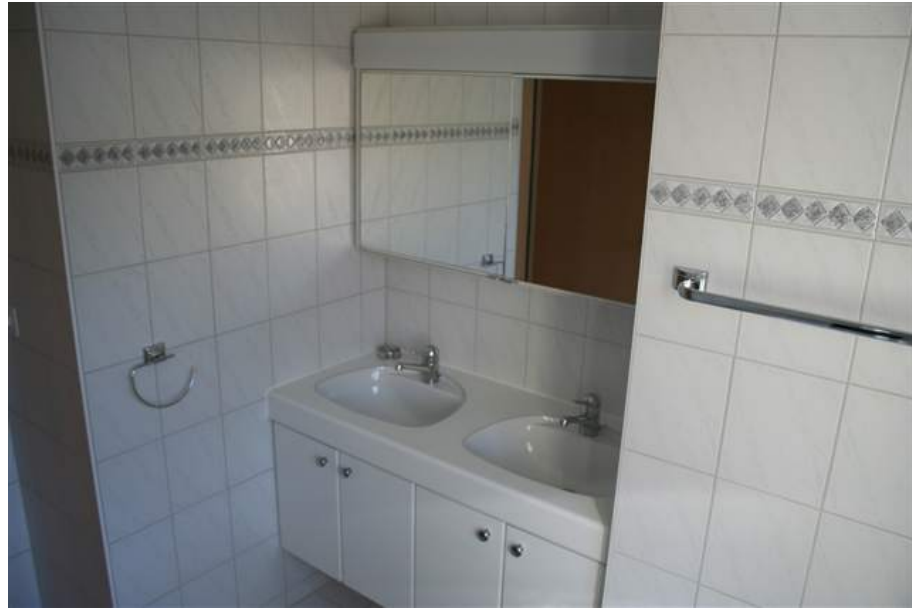
Bad/WC mit Doppellavabo